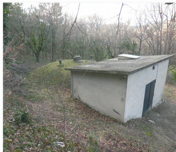
Photo : A l'arrière du vétuste local technique, le plus ancien de nos réservoirs, 250 m 3 . Pas une seule fissure dans le béton ouvrage artisanalement, il y a plus de 55 ans.

On peut signaler que les techniciens ont été surpris de la qualité de notre eau et de la structure irréprochable des réservoirs.