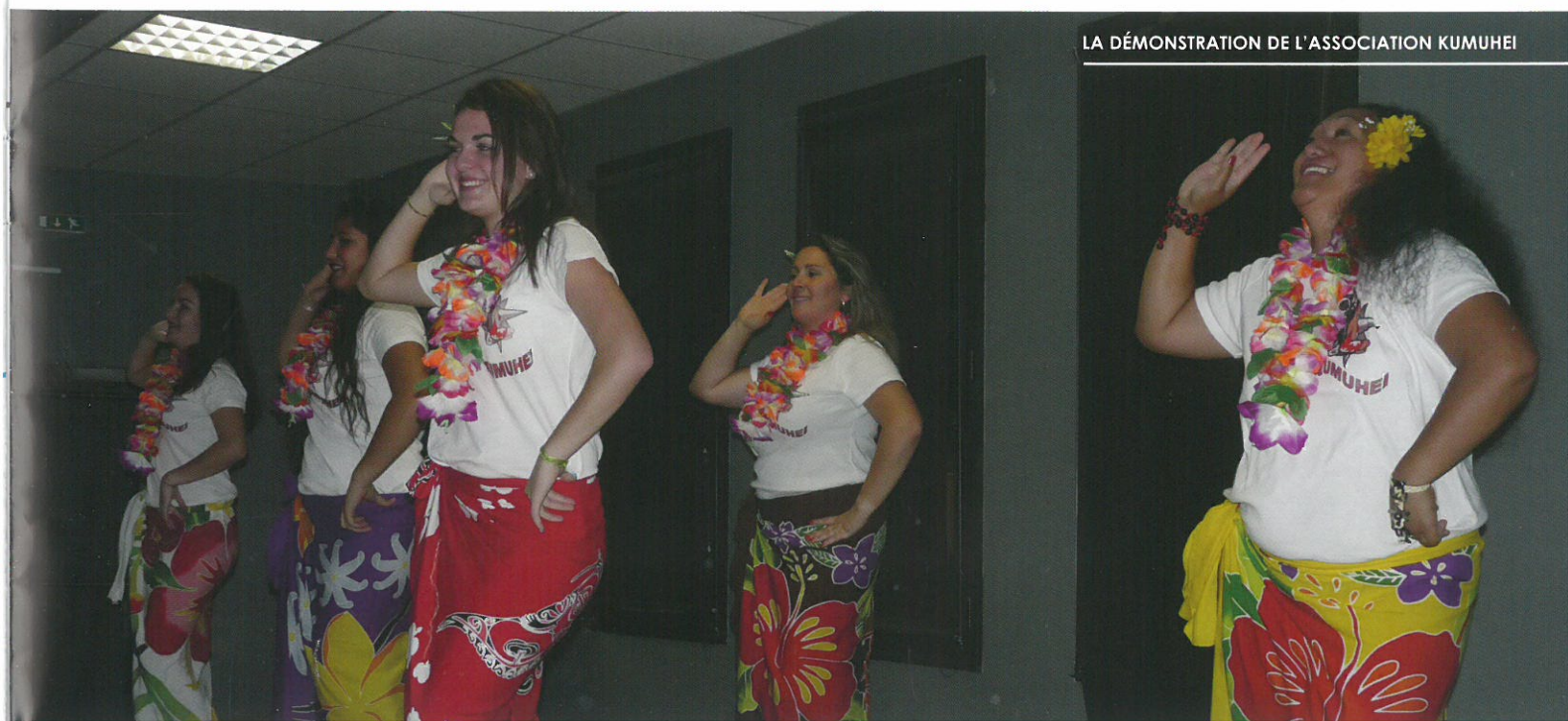
LA DÉMONSTRATION DE L'ASSOCIATION KUMUHEI

Encore merci à toutes les associations qui nous aident pour animer cette magnifique soirée.